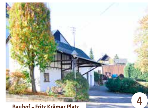
Bauhof - Fritz Krämer Platz