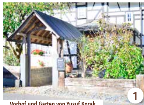
Vorhof und Garten von Yusuf Kocak

Sommervergnügen: Ein Eiswagen sorgt für Abkühlung!