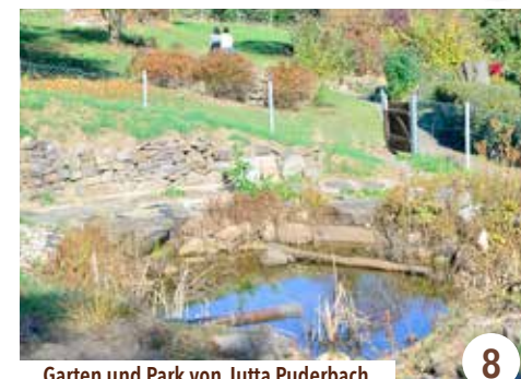
Garten und Park von Jutta Puderbach